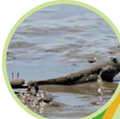
むつごろうとシオマネキ