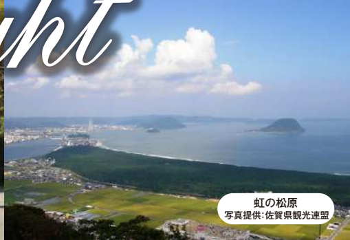
虹の松原